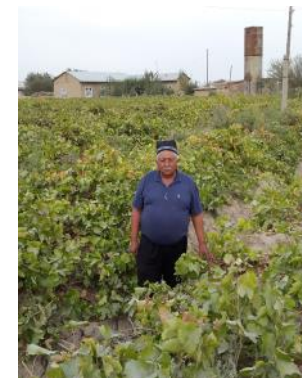
Узумни “ер токи” усулда етиштириш (Самарқанд вил., Ургўч тум.)