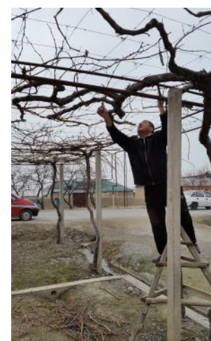
Ток тупларига шакл бериш (воши усулида)