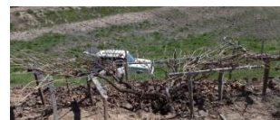
Токка паст танали шакл бериш усули (Тошкент вил., Паркент тум.)