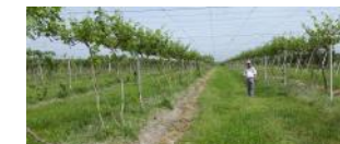
Узумни воши усулида шакллантириш (Самарқанд вил., Самарқанд тум.)