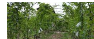
Узумни сўрилларда етиштириш (Тошкент вил., Тошкент тум.)