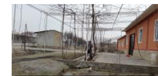
Токларга баланд танали шакл бериш (Фарғона вил., Олтиариқ тум.)