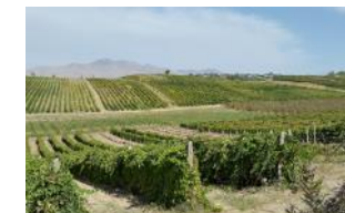
Токларни симбағазларда етиштириш (Тошкент вил., Паркент тум.)